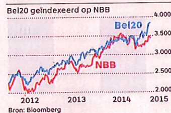
NBB EN BEL20

Het kapitaal en de reserves van de Nationale Bank bedroegen eind 2013 ruim 4,6 miljard euro, de herwaarderingsmeerwaarden 6,3 miljard, blijkt uit het jongste ondernemingsverslag. De toestand eind 2014 is nog niet bekend. De Nationale Bank publiceert op 25 maart haar jaarresultaten.