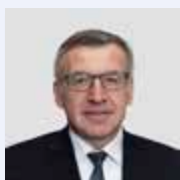
Steven Vanackere Vicegouverneur